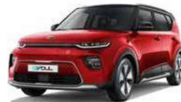
Inferno Red + Cherry Black (AH4)