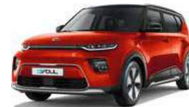
Mars Orange + Cherry Black (SE3)