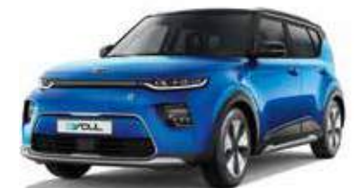
Neptune Blue + Cherry Black (SE2)