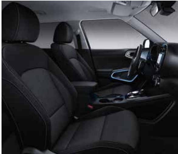
Zwarte stoffen zetelbekleding (standaard op More) of grijze (gratis optie op More) Zwarte stoffen zetelbekleding met groen boorduurwerk (optie op More)