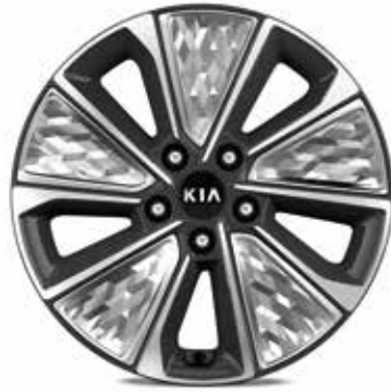
17" lichtmetalen velgen met 215/55 banden