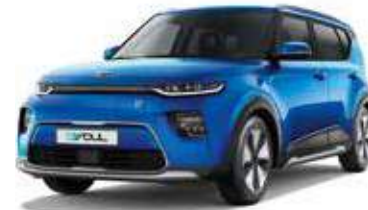
Neptune Blue (B3A)