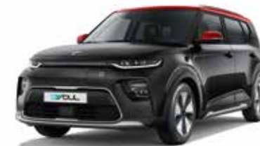
Cherry Black + Inferno Red (AH5)