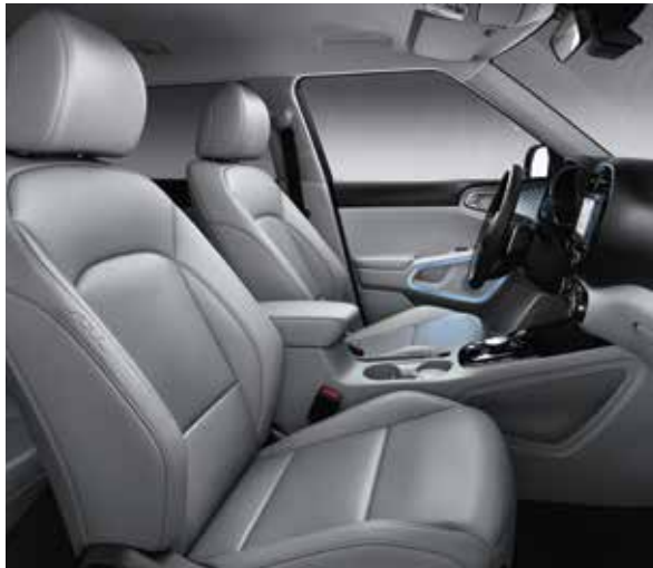
Grijze lederen zetelbekleding (optie via Leder Pack op More)