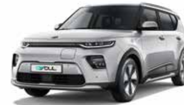
Sparkling Silver (KCS)