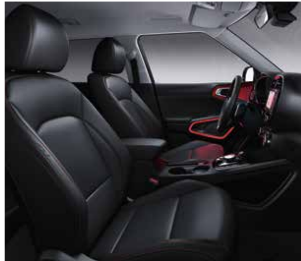
Zwarte lederen zetelbekleding met rood boorduurwerk (optie op More)