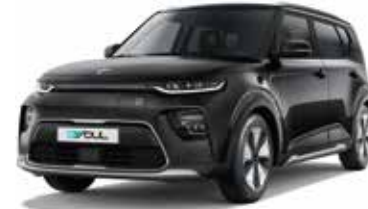
Cherry Black (9H)