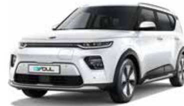
Snow White Pearl (SWP)