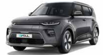
Gravity Grey (KDG)