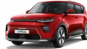
Inferno Red (AJR)