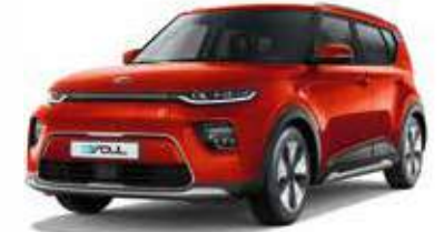
Mars Orange (M3R)