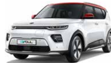
Clear White + Inferno Red (AH1)