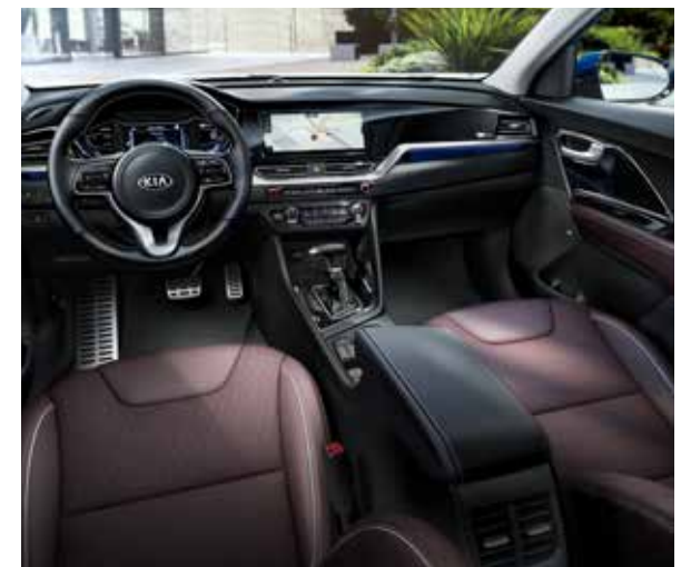
Pruimkleurig lederen zetelbekleding (optie op Sense en Business Line)