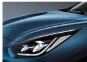
Deep Cerulean Blue (C3U)**