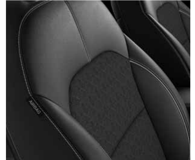
Zwarte halflederen / halfstoffen zetelbekleding (standaard op More)