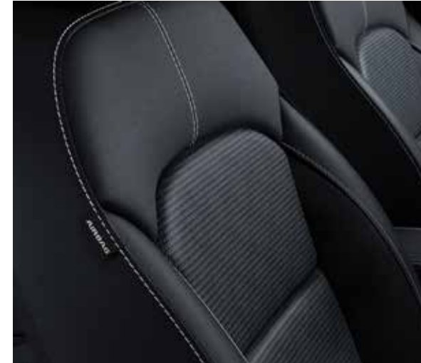
Zwarte stoffen zetelbekleding (standaard op Must en Navi Edition)