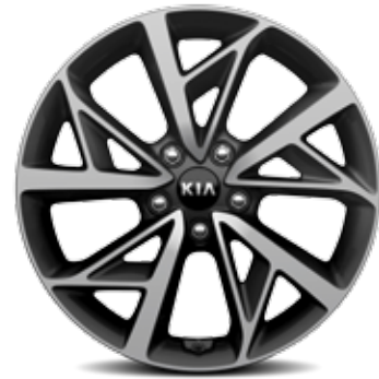
18" Lichtmetalen velgen met 225/45 R18 banden (standaard op Sense HEV)