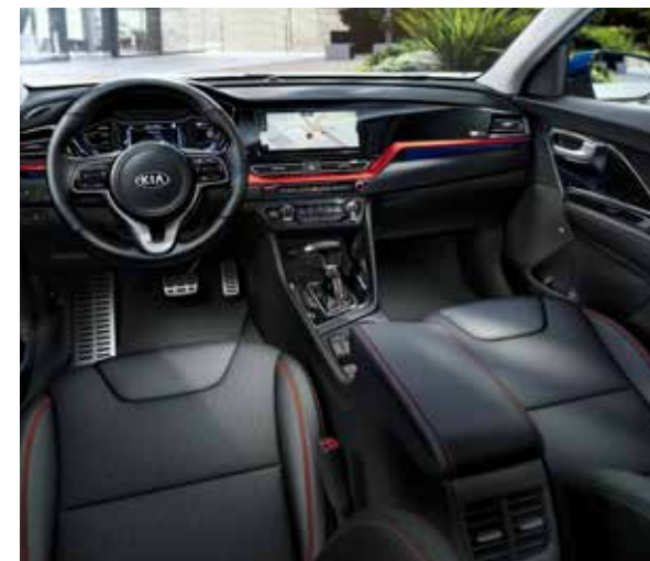
Zwarte lederen zetels met rood/oranje stiksels (optie op Sense en Business Line)