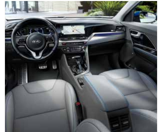
Grijze lederen zetelbekleding met blauwe stiknaden (gratis optie op Sense en Business Line)