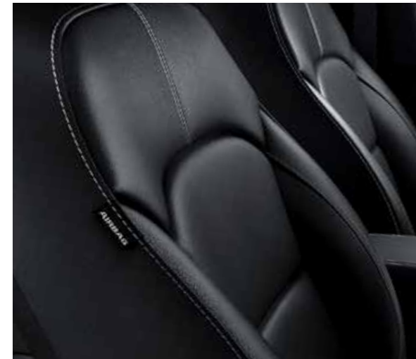
Zwarte lederen zetelbekleding (standaard op Sense en Business Line, optie via Leder Pack op More)