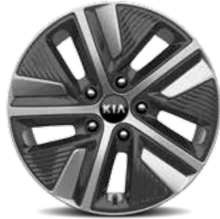
16" Lichtmetalen velgen met 205/60 R16 banden (standaard op Navi Edition, More, Sense PHEV en Business Line)