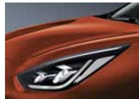
Orange Delight (DRG)**