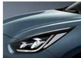
Horizon Blue (BBL)**