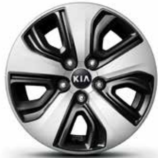
16" Lichtmetalen velgen met wieldeksel en 205/60 R16 banden (standaard op Must)