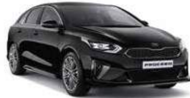
Black Pearl (1K)