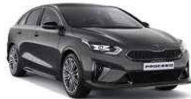
Dark Penta Metal (H8G)