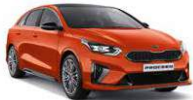
Orange Fusion (RNG)