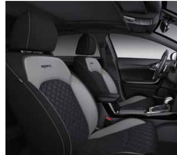
Halflederen / halfstoffen zetelbekleding (standaard op GT Line)