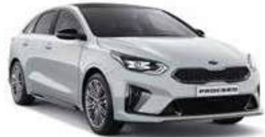
Casa White (WD)** (Niet beschikbaar op GT)