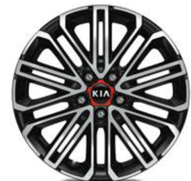
18" lichtmetalen velgen met 225/40 banden (standaard op GT)