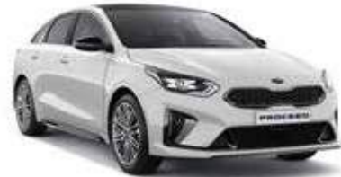
Deluxe White Pearl (HW2)