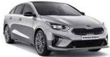
Sparkling Silver (KCS)