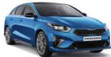
Blue Flame (B3L)