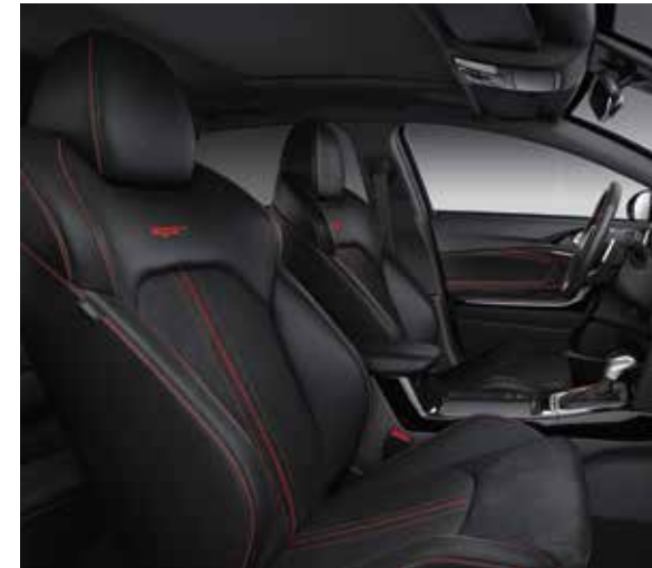
Zetelbekleding in leder / suede met rood borduurwerk (standaard op GT)