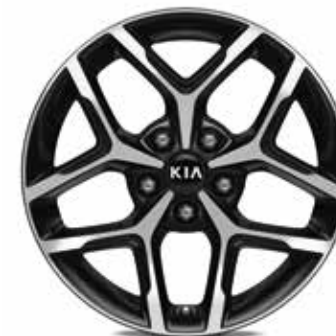
17" lichtmetalen velgen met 225/45 banden (standaard op GT line)