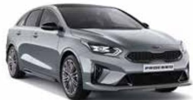
Lunar Silver (CSS)