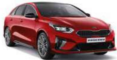
Infra Red (AA9) (Niet beschikbaar op GT)