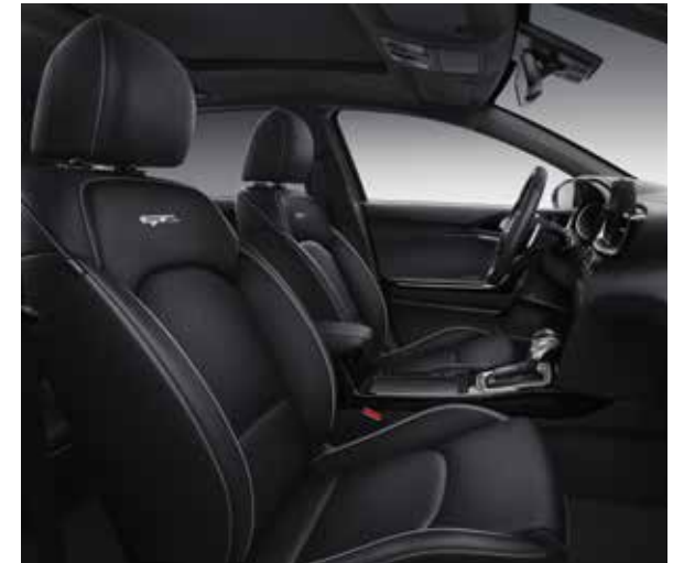
Lederen zetelbekleding met grijs borduurwerk (optie op GT Line)